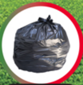
ถุงพลาสติก