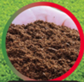
ปุ๋ยอินทรีย์