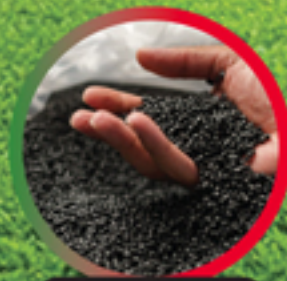
เม็ดพลาสติกรีไซเคิล