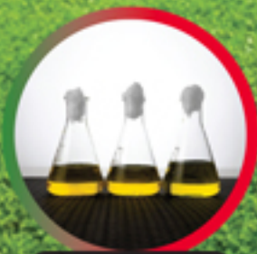
น้ำมันโพลีโพรพิลีน